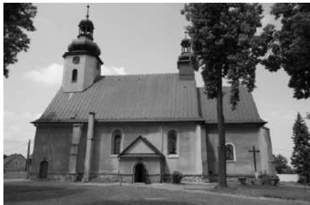
Sanktuarium Wniebowzięcia N.M.P. w Lubeku