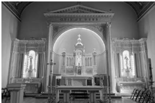
Kościół św. Stanisława Kostki u Ojców Oblatów w Lublińcu