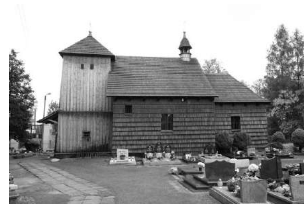
Drewniany kościół Narodzenia N.M.P w Szalszy