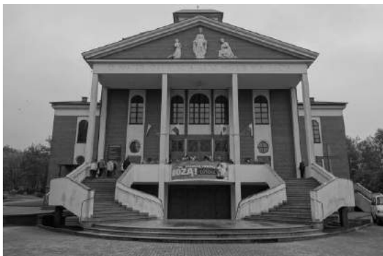
Sanktuarium Matki Bożej Kochawińskiej