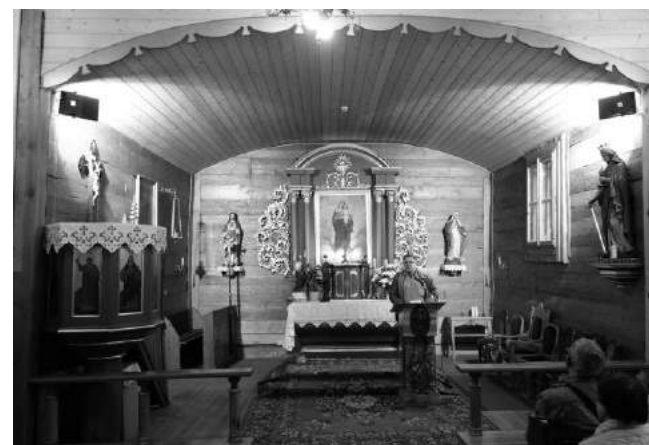
Ołtarz kościoła N.M.P w Szalszy