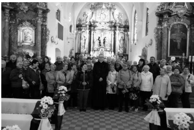
Parafia i Sanktuarium Matki Bożej Nieustającej Pomocy