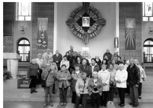
Wspólne zdjęcie przed obrazem Matki Bożej Kochawińskiej